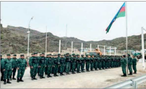
Aylardır, davam edən etiraz aksiyası öz nəticəsini verdi

Vətən müharibəsində ölkəmizin əldə etdiyi şanlı Zəfərdən ötən müddətdə Ermənistan acı məğlubiyyətin əvəzini müxtəlif çirkin yollarla çıxmağa çalışır, ekologiyamıza zərbə vurur, təbii sərvətlərimizi qanunsuz istismar edirdi. Rusiya sülhməramlı kontingentinin belə qanunsuz fəaliyyətdə şərait yaratması və birlik nümayiş etdirən ekofəalların gecə-gündüz, isti-soyuq demədən mübarizəsi və qanuni tələbləri nəticəsində Laçın-Xankəndi yolunda nəzarət de-fakto Azərbaycan tərəfdən həyata keçirilirdi. Ermənistan bu müddətdə dövlətimizə qarşı qarayaxma kampaniyası aparır, quray, “Laçın yolu blokadadır”, “Azərbaycan Qarabağda yaşayan erməni sakinlərlə qarşı genosid törətməyə hazırlaşır” kimi yalançı bəyanatlarla beynəlxalq ictimaiyyəti çaşdırır, Qarabağda yaşayan erməni sakinlərin Azərbaycana reintegrasiyasına mane olurdu. Lakin ilk gündən Laçın yolu bağlanmamış, Rusiya sülhməramlıları, Beynəlxalq Qırmızı Xaç Komitəsi, humanitar yüklər rahat şəkildə yoldan keçmişdir. Ermənistanın belə təxribatçı addımları Ermənistan ilə sərhəddə, Laçın-Xankəndi yolunun başlanğıcında sərhəd-buraxılış məntəqəsinin qurulmasını labüd etdi.