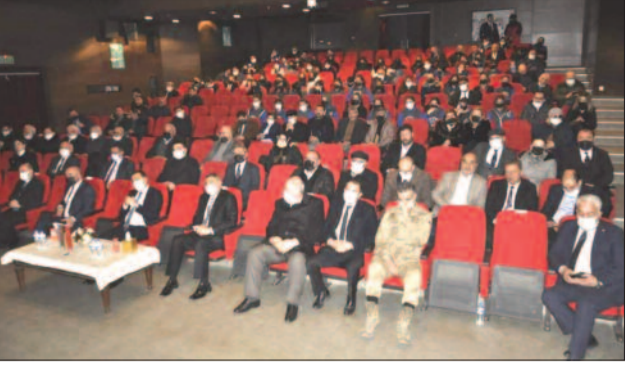
Türkiyənin Qars şəhərində Xocalı soyqırımının otuzuncu ildönümü ilə əlaqədar anma mərasimi keçirilib.