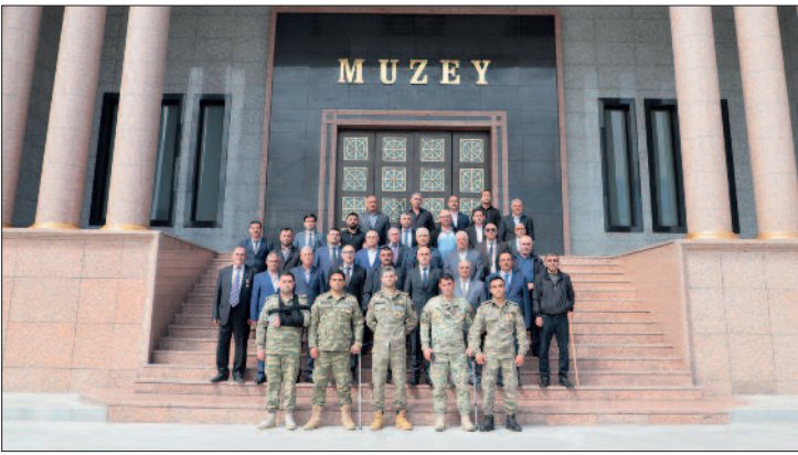
Ölkəmizdə 2023-cü ilin "Heydər Əliyev hüd Ailələri Naxçıvan Muxtar Respublika İli" elan olunması ilə əlaqədar olaraq dahi Təşkilatının kollektivi, şəhid ailələri, eləcə