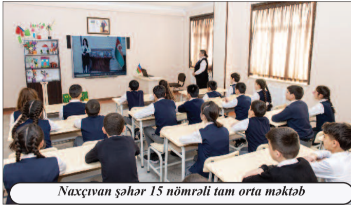
Naxçıvan şəhər 15 nömrəli tam orta məktəb

İnteraktiv dərslərdə muzeyin bələdçisi bildirib ki, muzeydə 2 mindən çox eksponat var və onlardan 400-ə yaxını ekspozisiyada nümayiş etdirilir. Ötən əsrin əvvəllərindən başlayaraq təcavüzkar erməni daşnaklarının azərbaycanlılara qarşı müxtəlif illərdə törətdikləri dəhşətli cinayətlərin izləri bu eksponatlarda öz əksini tapıb. Azərbaycanın suverenliyi və ərazi bütövlüyü uğrunda döyüşlərdə həlak olanların xatirəsini əbədiləşdirilən muzeydə şəhidlərin fotosəkilləri, şəxsi sənədləri, döyüş fəaliyyətlərini əks etdirən materiallar saxlanılır.