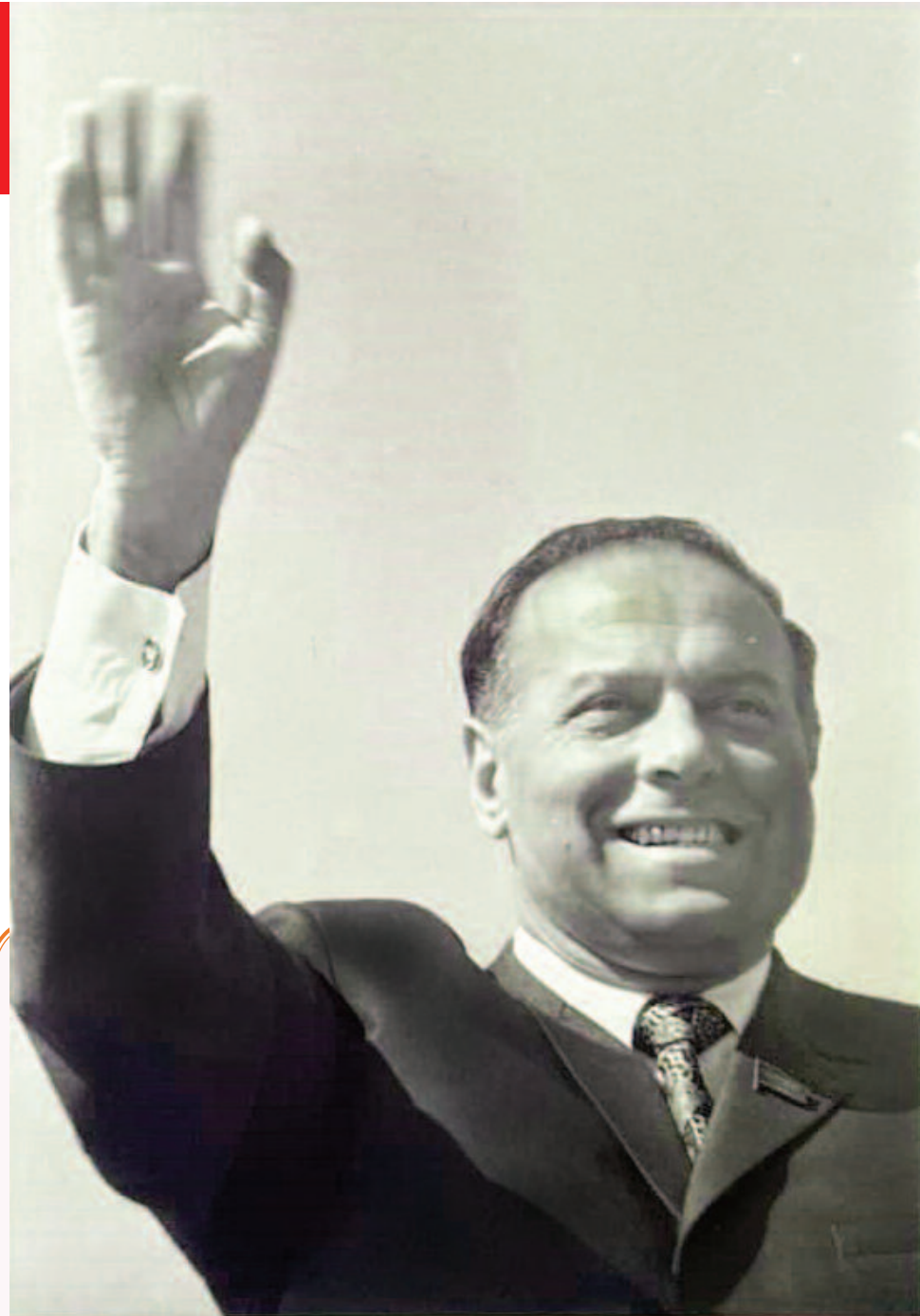
(əvvəlki 1-ci səhifədə)