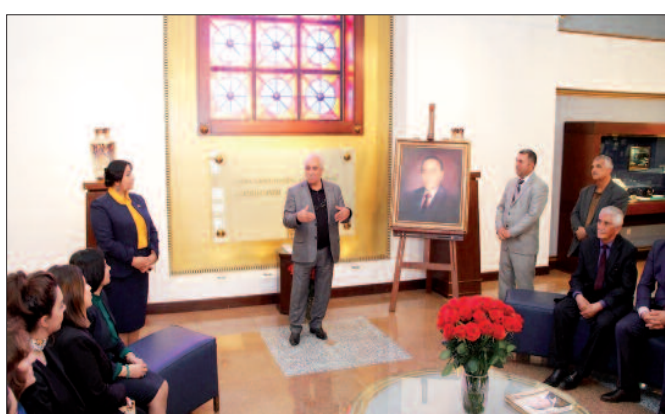
Naxçıvan Muxtar Respublikası Rəssamlar