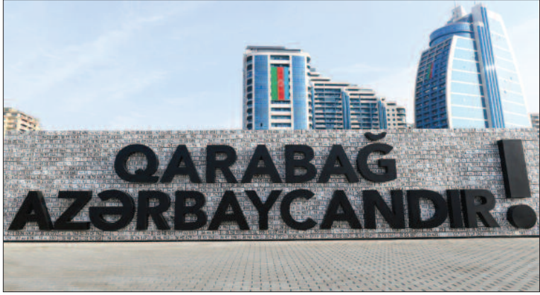
Milli Ordu quruculuğuna Naxçıvandan başlanılıb

Bir xalqın, bir dövlətin varlığını təsdiq edən amillərdən biri də ordudur. Bu ordunun əsasını xalqın yetişdirdiyi igid, qeyrətli, vətənpərvər övladlar təşkil edir. O övladlar ki Vətən, torpaq yolunda canlarından keçməyə hər an hazırdırlar. Xalqımız həmişə belə vətənpərvər övladları ilə fəxr edib və edəcəkdir. Ümummilli Liderimiz Heydər Əliyev demişdir: "Ordu ölkəmizin, millətimizin, dövlətimizin, müstəqilliyimizin dayəğıdır... Xalqla ordunun birliyi həm xalqın qüdrətini artırır, həm də ordunu daha qüvvətli edir" . Bu birliyi tarixboyu torpaqlarımızı yadellilərdən qoruyan qeyrətli igid oğul və qızlarımızın şücaətində görmüşükdük. Lakin 44 günlük şanlı Vətən müharibəsində bu birlik "Dəmir yumruq" olub düşmənin başını əzdi, illərlə həsrətini çəkdiyimiz torpaqlarımız qüdrətli ordumuzun gücü, cəsarəti hesabına düşmənin tapdağından azad edildi. Qürurla xatırladığımız o günlərə keçməzdən əvvəl gəlin ordumuzun formalaşma, inkişaf tarixinə qısaca nəzər salaq.