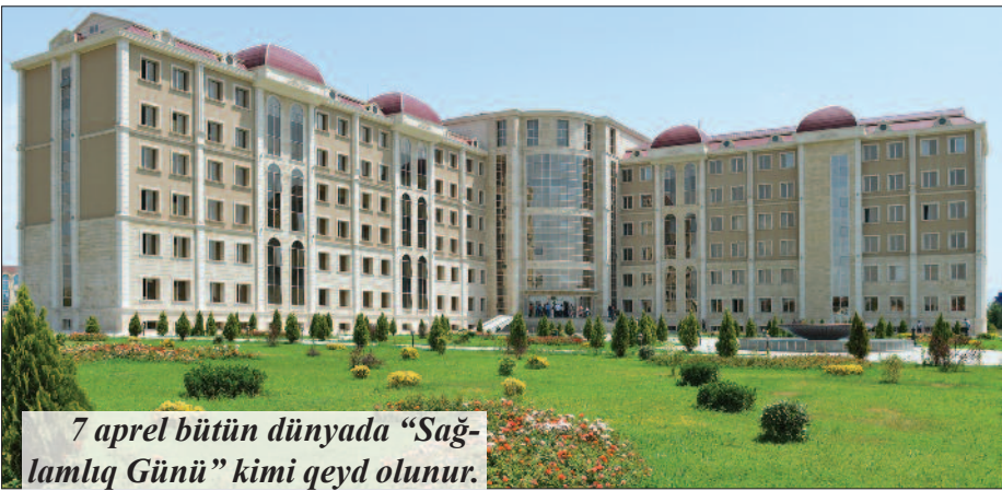
7 aprel bütün dünyada "Sağlamlıq Günü" kimi qeyd olunur.

Bu tarix 1948-ci il aprelin 7-də BMT-nin xüsusi agentliyi kimi yaradılan Ümumdünya Səhiyyə Təşkilatının fəaliyyətə başlaması ilə əlaqədardır.