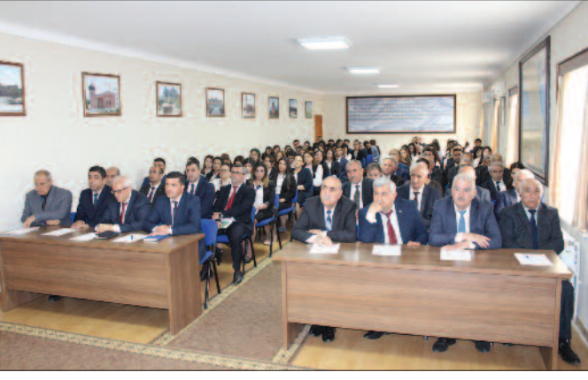
AMEA Naxçıvan Bölməsi, Naxçıvan Muxtar Respublikası Yazıçılar Birliyi və muxtar respublikanın ali təhsil müəssisələrinin birgə təşkilatçılığı ilə "Əhməd Cavad - 130" mövzusunda elmi konfrans keçirilib.