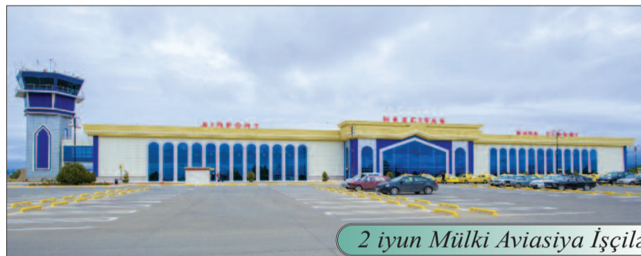
2 iyun Mülki Aviasiya İşçilərinin Peşə Bayramı Günüdür

Azərbaycan Respublikası Prezidentinin 2006-cı il 18 may tarixli Sərəncamına əsasən iyunun 2-si hər il ölkəmizdə "Mülki Aviasiya İşçilərinin Peşə Bayramı Günü" kimi qeyd edilir.